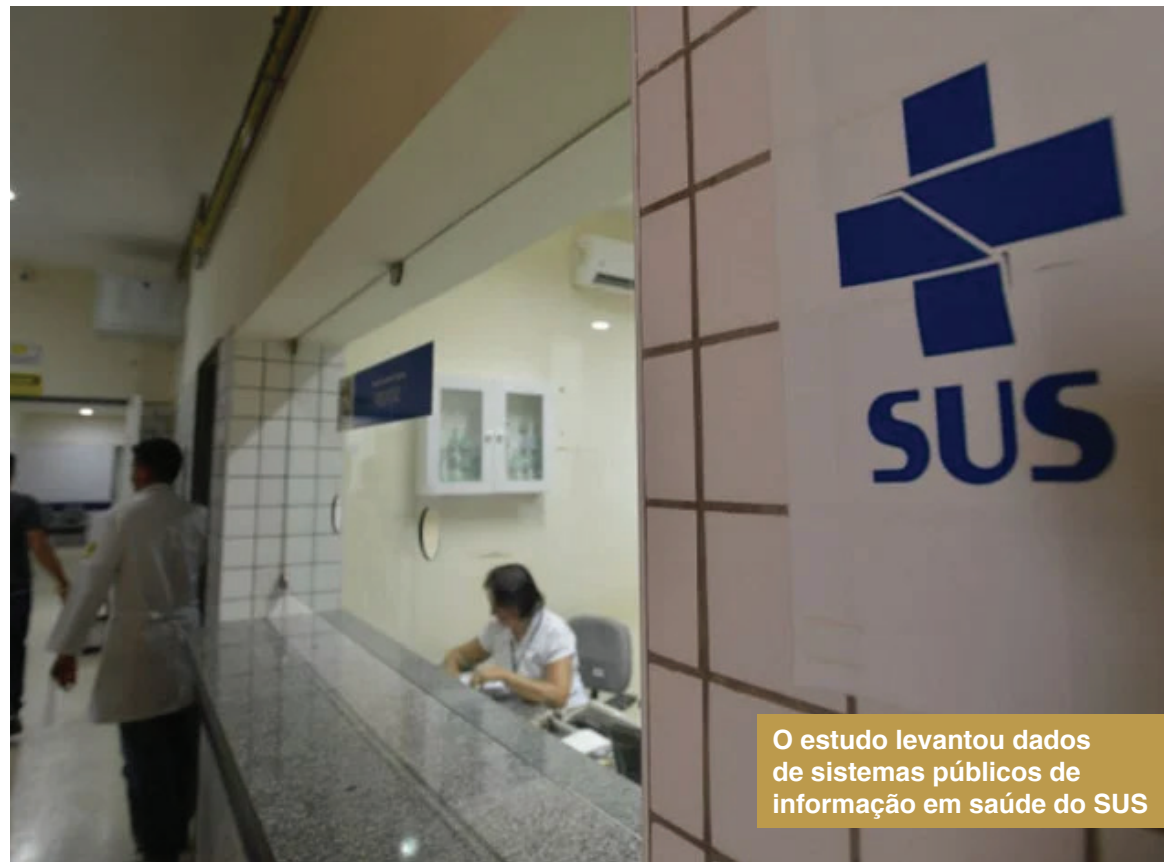
O estudo levantou dados de sistemas públicos de informação em saúde do SUS

“Os novos métodos de modelagem são importantes como primeiros passos para estimar a carga econômica da obesidade que já ocorre na infância e adolescência, além de reforçar